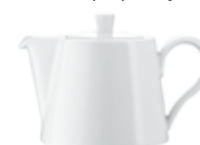
Kanvica kávy (360 ml) 2 minúty, 33 sekúnd