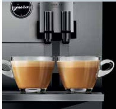
Variabilný dvojitý výtok s 2 výtokmi na kávu a 2 výtokmi na mlieko