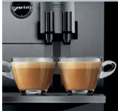
Variabele dubbele uitloop met 2 uitlopen voor koffie en 2 voor melk.