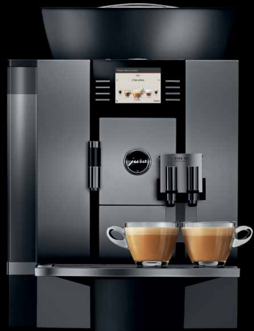
GIGA X3 Professional

Dankzij een groot aanbod aan toebehoren zoals de kopjeswarmer, de melkkoeler, de set afvoer koffieresidu, de set afvoer restwater en de interface voor afrekeningsystemen alsmede dankzij een aantrekkelijk assortiment aan meubelen kan voor ieder toepassingsgebied een optimaal en aan de behoeften aangepaste totaaloplossing worden samengesteld.