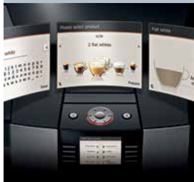
Individueel programmeerbaar startbeeldscherm